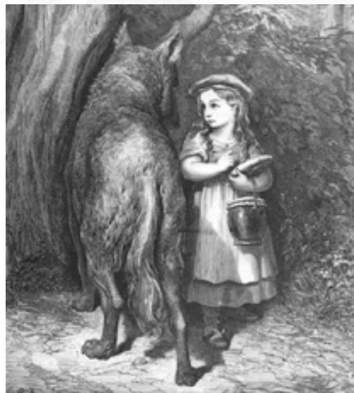
Cappuccetto Rosso e il lupo in una celebre illustrazione di G. Doré.

Romanzi, favole e saggi recenti, come “Insieme con i lupi” di Nicholas Evans, “Oltre il confine” di Cormac McCarthy, “La via dei lupi” di Carlo Grande, “Lupi” di Barry Lopez, “Mai gridare al lupo” di Farley Mowat e “L'occhio del lupo” di Daniel Pennac, restituiscono il lupo alla sua dimensione naturale, simbolo di una natura antica e selvaggia. 🐾 I.B.