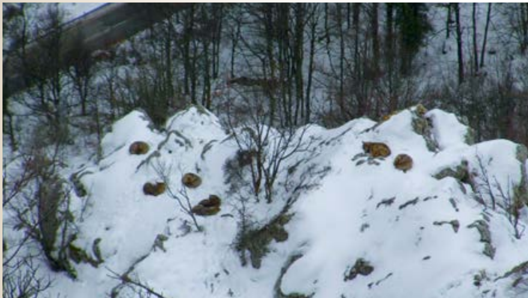
Nella valle dell'alto Sangro, nel cuore del Parco, un branco di sette lupi si riposa sulla neve, invisibile dalla sottostante strada statale, lontana poche decine di metri.

elaborazione, si evince che nel Parco esiste una delle popolazioni di lupo con una densità (numero di individui per unità di area geografica) tra le più alte su scala nazionale. Abbiamo rilevato densità invernali tra i 4 ed i 6 lupi /100 km 2 , con una popolazione di lupi strutturata in un minimo di 7-8 branchi residenti, presenti annualmente nel Parco propriamente detto e nella sua Zona di Protezione Esterna.