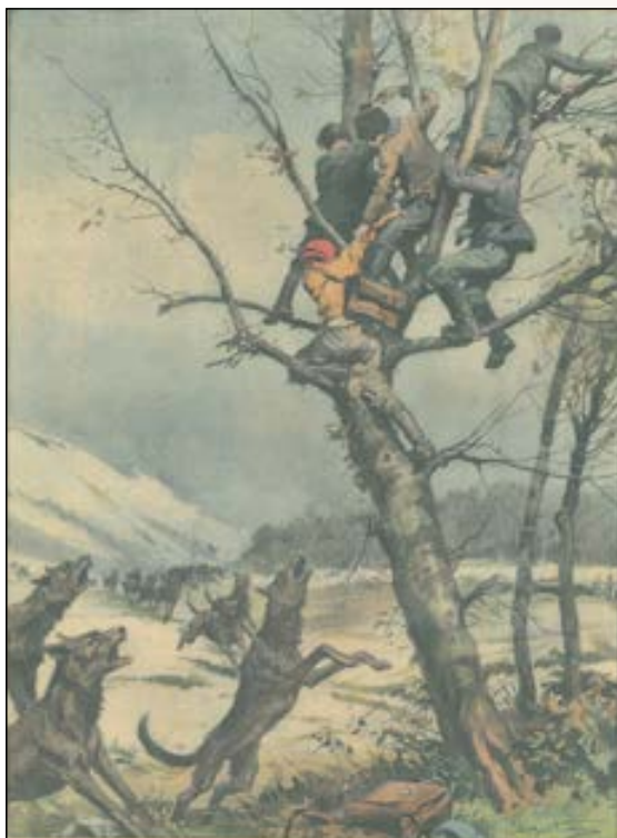
La salvezza nell'albero. Gruppi isolati che scappano dalla caccia di un villaggio in Transilvania, vengono in un frangente di ogni aiuto dalle montagne, sono costretti a cercare e rifugiarsi al grande pino solitario che si staglia in alto contro il maestoso castello. Stroica di S. Ionescu.