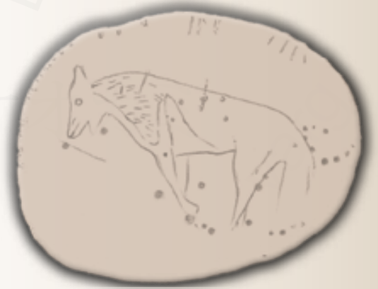
Incisione di lupo su ciottolo. Paleolitico superiore. Grotta Polesini, Tivoli (Rm)