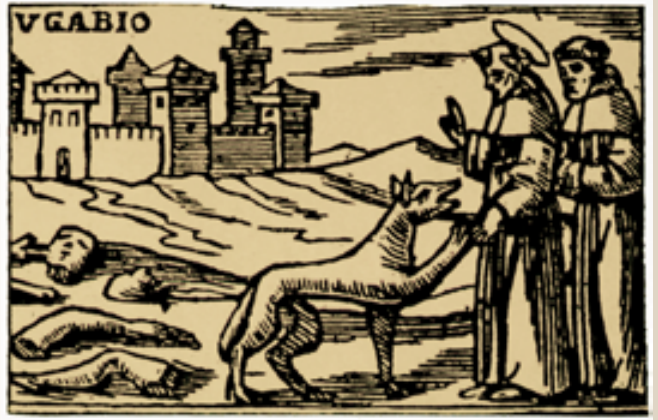
San Francesco e il lupo di Gubbio, in una rara stampa del XV sec.

L'ultimo lupo della Sicilia scomparve nel 1937; negli anni '70 del '900 soltanto piccoli nuclei sopravvivevano nell'Appennino centrale ed in Calabria.