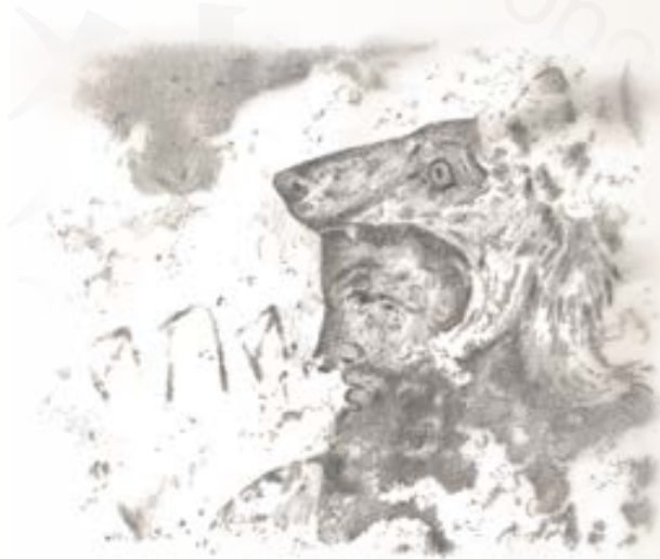
Il dio etrusco Aita raffigurato nella tomba dell'Orco di Tarquinia (Vt), IV secolo a.C.

Nell'antichità classica spesso il lupo incarnava questo dualismo, in Grecia era uno degli animali sacri ad Apollo, simbolo del sole; ad Atene il tempio a lui dedicato sorgeva sul monte Licabetto (dal greco lykavittos, "collina dei lupi") ed il bosco sacro che lo circondava era chiamato lukaion o regno del lupo, luogo dove Aristotele teneva le sue lezioni: da qui nacque la definizione di "liceo".