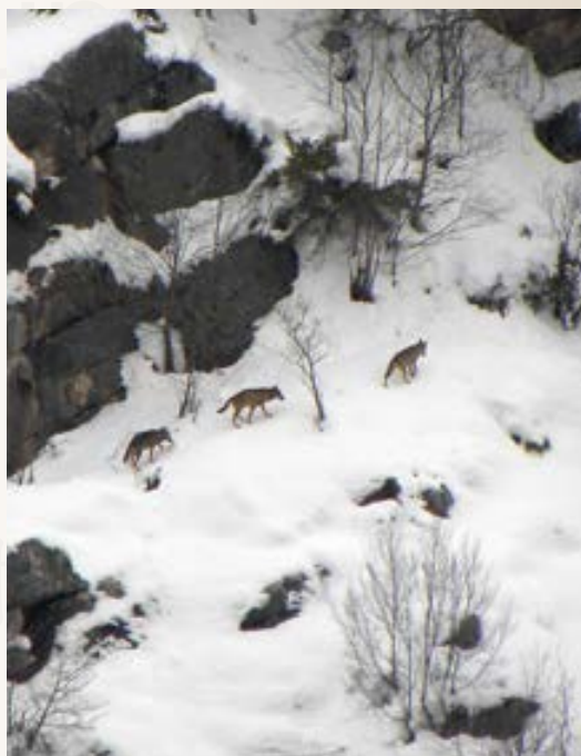
Prede e predatori nel Parco. A sinistra, un lupo, apparentemente distratto, controlla i movimenti di un gruppo di cervi nel bosco. A destra, un piccolo branco di lupi pattuglia il territorio. In basso, cornacchie grigie (nella foto), gazze e corvi in alcuni casi tengono d'occhio i lupi sperando di procurarsi del cibo con i resti di eventuali prede.