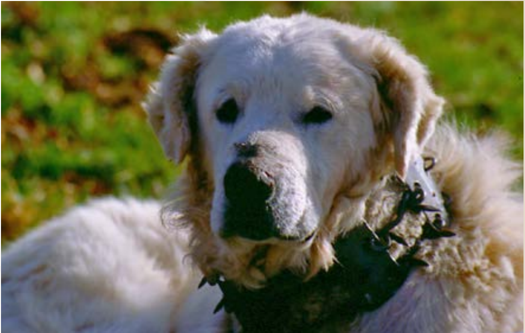
Il cane da pastore, o mastino abruzzese, è il più antico strumento per proteggere le greggi dagli attacchi di lupi e orsi. Secondo la tradizione indossa il "vreccale", collare di ferro irto di punte, a difesa della gola.

assistere i pochi allevatori colpiti dallo sparuto numero di lupi rimasti in poche isole montane dell'Appennino centro-meridionale (e in questo modo facilitare la predisposizione culturale verso una specie a cui era stata recentemente accordata la protezione legale), lo stesso strumento necessita ora di una profonda rivisitazione nell'ambito di una strategia che deve necessariamente essere più ampia ed articolata.