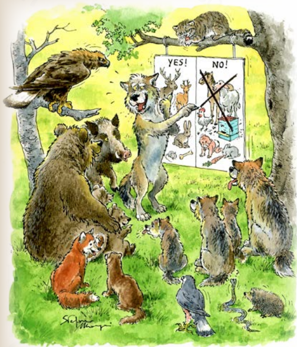
Il lupo saggio tiene una lezione sulla corretta dieta da seguire affinché non nascano conflitti con gli umani!