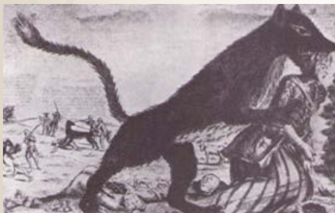
La Bestia di Gevaudan in una stampa del XVIII sec. A questo leggendario lupo furono attribuite più di cento efferate uccisioni di donne, uomini e bambini tra il 1764 e il 1767 nella Francia meridionale.

L'immaginario minaccioso ed oscuro e quindi la visione più nefasta e trascendente della "bestia" prevalsero per molti secoli, ne sono testimoni la letteratura e l'iconografia dell'epoca.