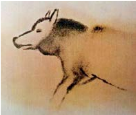
Pittura rupestre del paleolitico superiore raffigurante un lupo. Grotta Font de Gaume, Francia

Il lupo, predatore scaltro ed efficiente, ha sempre suscitato nell'uomo sensazioni forti e contraddittorie che hanno attraversato varie epoche: assassino e ladro di greggi, sacrificato nei sanguinari spettacoli circensi, ma anche, per le sue caratteristiche, simbolo di forza guerriera e fonte di ispirazione di miti, leggende e fiabe.