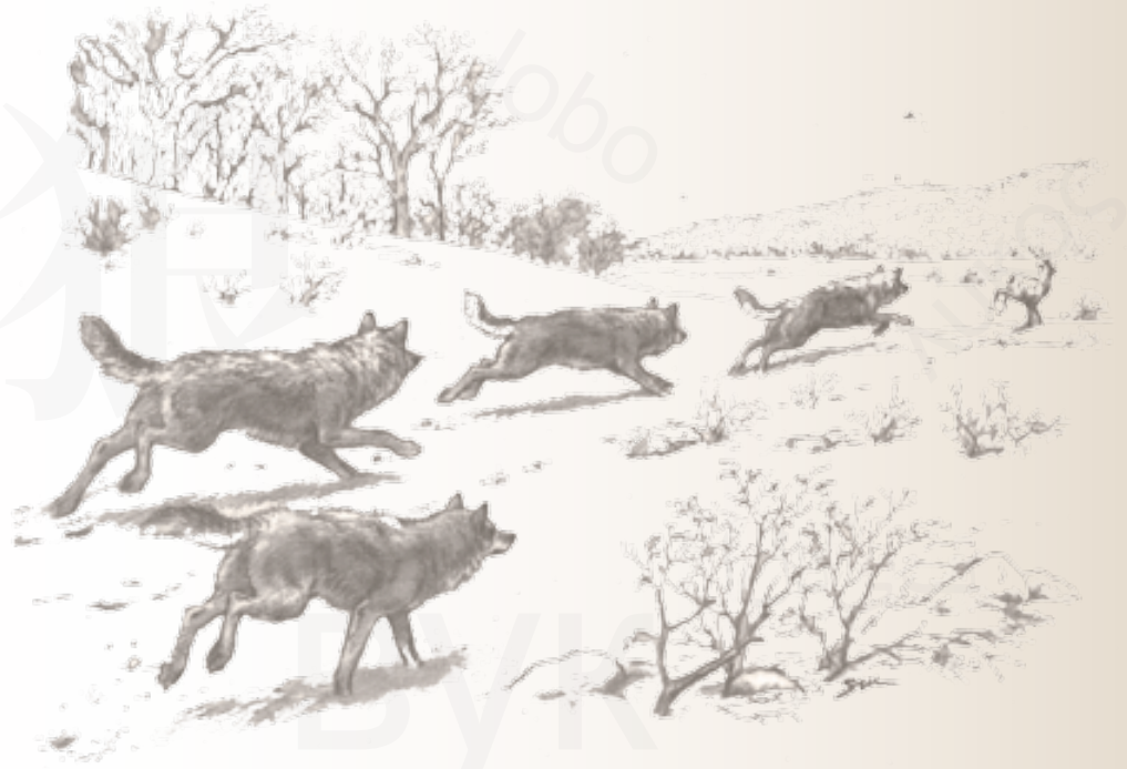
Il lupo, grazie all'olfatto molto sensibile, alla resistenza fisica e alla conoscenza del territorio, è in grado di cacciare in branco grandi prede come cervi e cinghiali.

Non è vero, come spesso si racconta, che i lupi tra di loro non si uccidono mai: anzi, nelle popolazioni selvatiche indisturbate dall'uomo, l'aggressione da parte di altri lupi è la prima causa