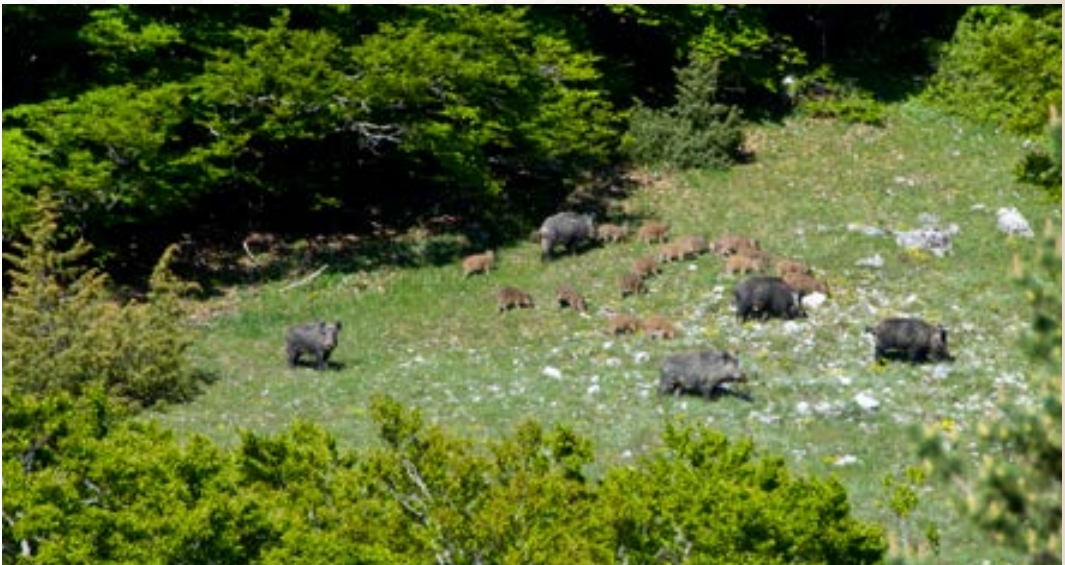
I cinghiali (sopra), prolifici e molto diffusi, e i cervi (pagina di fronte), assai numerosi nel territorio del Parco, costituiscono una importante fonte di alimentazione per i lupi.

L'alta disponibilità e consumo di animali domestici da parte del lupo nel Parco rappresenta un problema ecologico, sanitario e gestionale inatteso e ovviamente di non poco conto; esso rischia di compromettere il ruolo ecologico del lupo all'interno dell'ecosistema Parco, così come