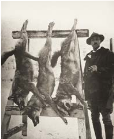
Nei primi decenni del secolo scorso il lupo, considerato “specie nociva”, veniva legalmente cacciato con armi da fuoco, trappole e veleno. Tale situazione rimase immutata fino agli inizi degli anni '70.

Finalmente, in quel decennio, fu varato il celebre progetto di ricerca e tutela del lupo italiano chiamato “Operazione San Francesco”, realizzato grazie all'azione congiunta del Parco Nazionale d'Abruzzo, che ospitava ancora una popolazione vitale di lupi, e del WWF, che impiegò cospicui fondi e risorse umane.