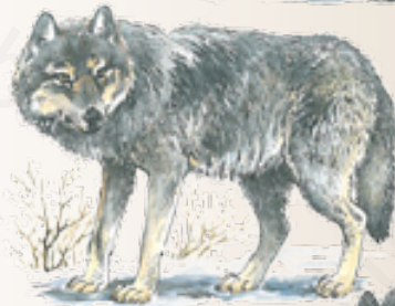
Lupo grigio del Nord America. Il pelame presenta una grande variabilità, dal grigio scuro al nero.