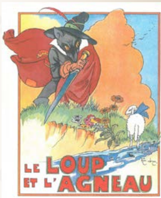
La fiaba Il Lupo e l'agnello illustrata da Felix Lorioux in un libro del 1919.