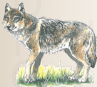
Lupo grigio europeo