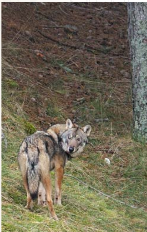
Un bell'esemplare di lupo sorpreso nel suo ambiente naturale, nel Parco Nazionale d'Abruzzo, Lazio e Molise.