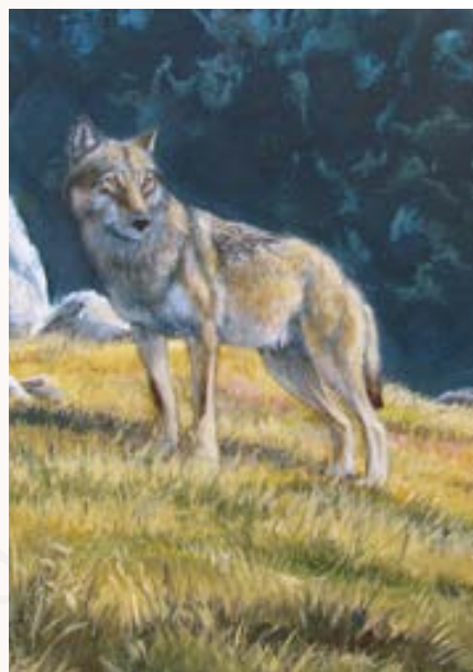
L'area faunistica adiacente al museo del lupo ha più volte ospitato il lieto evento della nascita di cuccioli. Nella foto, uno dei due giovani nati a maggio del 2013.