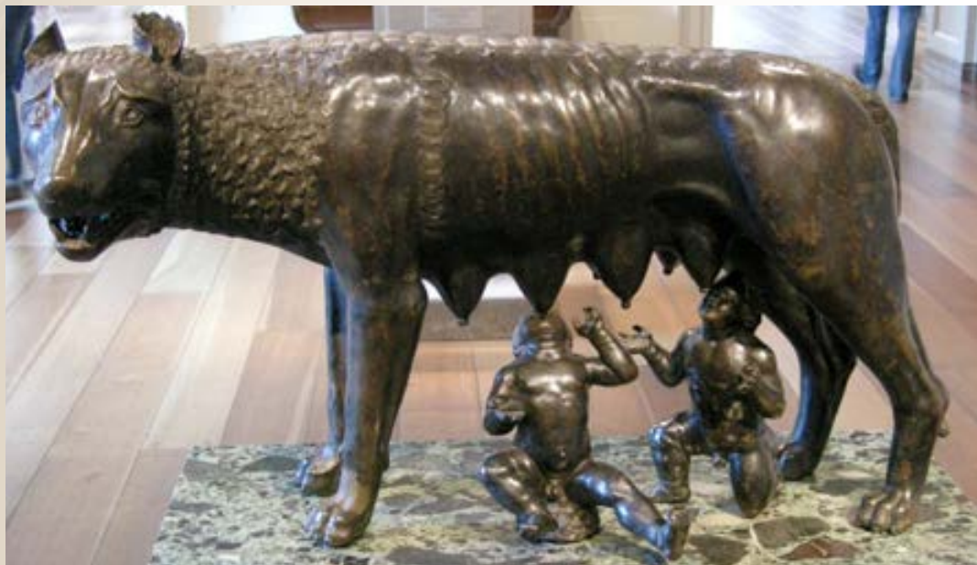
La leggendaria lupa capitolina simbolo di Roma. Musei Capitolini, Roma.

Presso gli antichi sabini, e poi in epoca romana, il lupo era sacro al dio Marte, padre di Romolo e Remo, secondo la leggenda adottati ed allattati da una lupa, che divenne per questo uno dei simboli più significativi della civiltà romana.